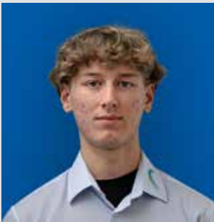
Finn Cron Fachmann Kundendialog