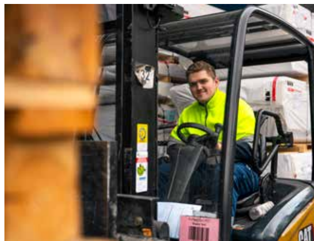
Immer auf Zack mit dem Stapler.