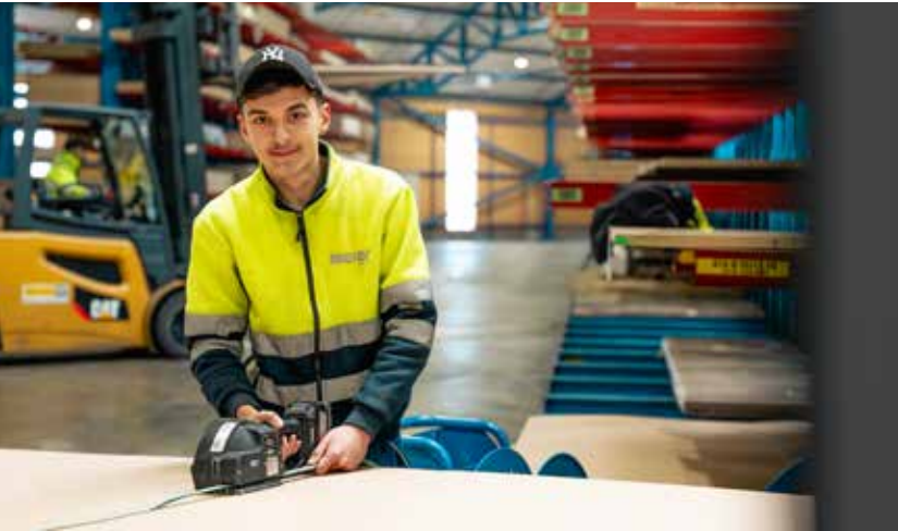
Enri beim Binden von Ware.

sorgfältig einen Auftrag nach dem anderen ab. Das Material wird dann beim Übergabeplatz deponiert und mit der Versandetikette und der Behälteretikette versehen.